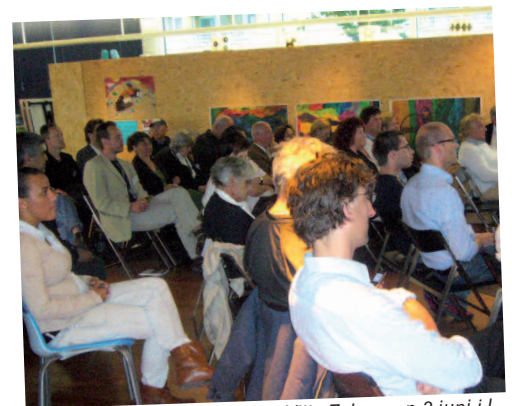
Ondernemersbijeenkomst in Villa Zebra van 3 juni j.l.