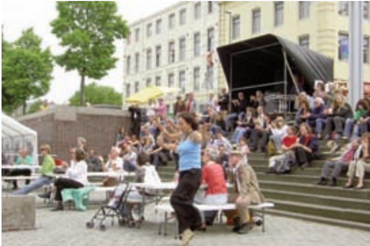
Dansen op Carlama's balkan-ritmes (North Sea Round Town 2008)

Dit jaar organiseren de OVN en Streef Productions voor de derde keer concerten tijdens North Sea Round Town op het buitenpodium aan de Maaskade. Dit podium staat op een historische plek, het is de plek waar de oude Maasbrug de rivier over dook en onze mariniers de Duitse invasie drie dagen staande hielden.