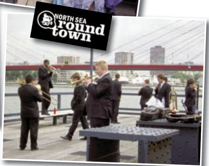
De beste talenten uit de hele USA on tour met het Next Generation Jazz Orchestra spelen zich warm achter het podium.