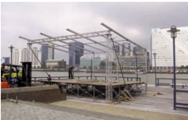
Podium in wording (North Sea Round Town 2008)

Welcome on board! Dynamisch midden in de rivier en stad ligt het Noordereiland als supercruiser voor anker. Met o.a. 3.000 koppen, een sloopshoorn, navigatielichten, de machinekamer (Pharaoh Sanders Alley) is het Noordereiland klaar voor de North Sea Round Town 2009. Het podium wordt geplaatst op het bruggenhoofd aan het einde van de van der Takstraat, vlakbij café Tejas. Het is de plek waar de oude Maasbrug de rivier over dook en onze mariniers in 1940 de Duitse invasie drie dagen staande hielden. Dit jaar wordt de 3de keer dat de OVN het podium organiseert op het Noordereiland. Na de 1ste editie is ons podium door NSRT benoemd tot kernpodium van het festival. (vervolg op pagina 2).