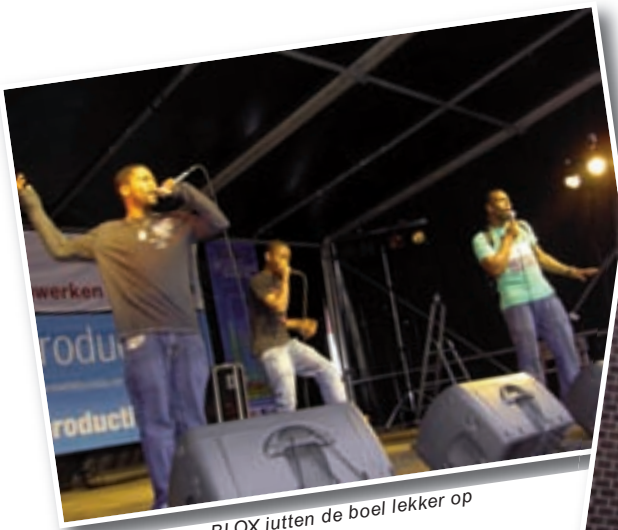
De rappers van BLOX jutten de boel lekker op

Als voorproefje op NSRT 2009 op het Noordereiland een overzicht in foto's van het evenement in 2008.